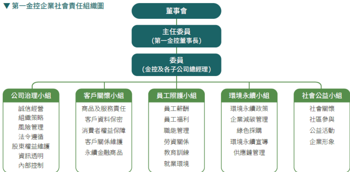
▼ 第一金控企業社會責任組織圖

第一金控「企業社會責任委員會」為集團推動企業永續之核心組織，係第一金控董事會於 2011 年通過設置由董事長擔任主任委員，集團各公司總經理擔任委員，下設「公司治理」、「客戶關懷」、「員工照護」、「環境永續」及「社會公益」小組等跨公司之執行單位，各子公司亦指定一專責單位，負責該公司各項資訊之提供及溝通協調，主要團隊約 78 人(主任委員 1 人、委員 8 人、召集人 2 人、總幹事 5 人、各小組組員共 62 人)，並以行政管理處公司治理組為事務單位，由專職人員 6 人負責集團整體企業社會責任之規劃與推動，由上而下有效具體貫徹各項年度目標。